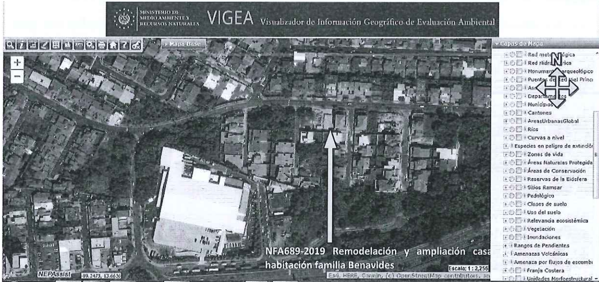
Figura 1. Croquis de ubicación